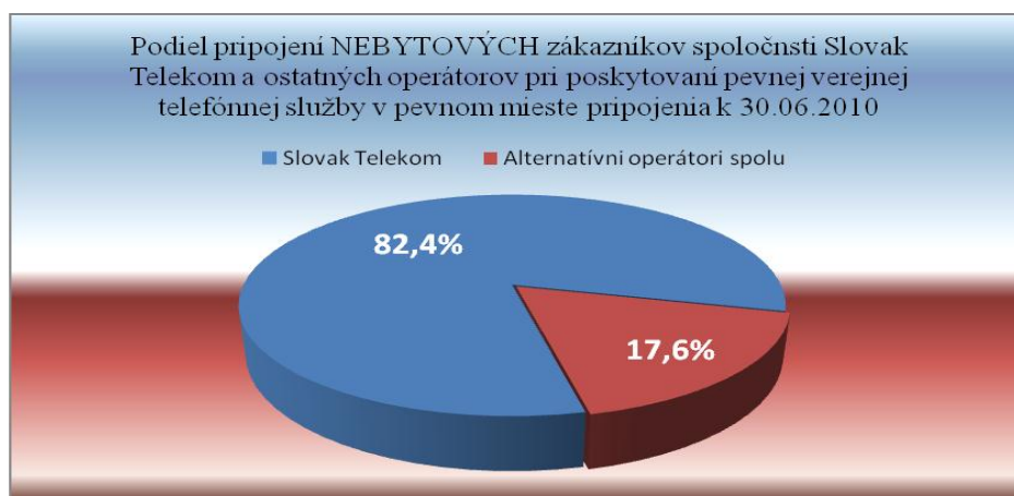
Graf č. 2

Podiel najvýznamnejších a do počtu najväčších alternatívnych operátorov je znázornený v grafe č. 3. Tento podiel je vypočítaný k počtu pripojení nebytových zákazníkov len vo vlastníctve ostatných podnikov bez pripojení nebytových zákazníkov spoločnosti Slovak Telekom. Najväčší alternatívni operátori podľa počtu nebytových pripojení sú spoločnosť Swan, a.s. s podielom 37,1 % a Slovanet, a.s. s 20% podielom. Tretím najväčším alternatívnym operátorom, ktorý poskytuje verejnú telefónnu službu nebytovým zákazníkom je spoločnosť ŽSR s podielom 10,5 %. Podiel počtu pripojení nebytových zákazníkov ostatných 6 alternatívnych operátorov spolu bol k 30.6.2010 na úrovni 18,5 %.