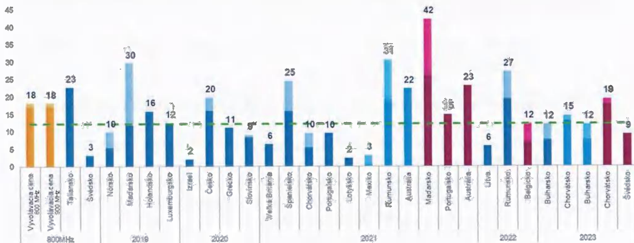
Obrázok 1 – vyvolávacie ceny za 2x5 MHz blok (mEUR) v EU a OECD od roku 2018 – pásma 700, 800, 900 MHz, ceny prepočítané v parite kúpnej sily (PPP)

mal dostupné tie najmodernejšie služby. Vyzývali sme úrad, aby prišiel s analýzami, že takto nastavené ceny a ich prípadné navýšenie v priebehu výberového konania nebudú pri výsledku výberového konania kontraproduktívne, odčerpávajúce z trhu toľko potrebné prostriedky na ďalšie investície. Úrad túto žiadosť v predloženej konzultácii opomenul, preto prikladáme niekoľko údajov, ktoré poukazujú, že vyvolávacie ceny v pripravovanom výberovom konaní dosahujú vysoké hodnoty a môžu nakoniec pôsobiť demotivačne a mať vplyv na budúcu mieru investícií.